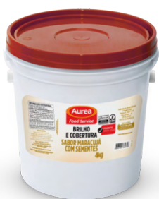
Maracujá com Sementes 4kg