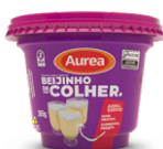
Beijinho de Colher 365g