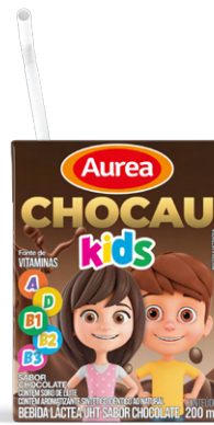
Bebida Láctea 200ml