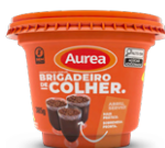
Brigadeiro de Colher 385g